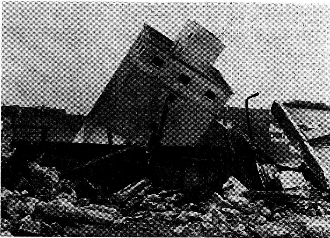
Der letzte Actienbrauerei-Silo ist gestürzt

Punkt 16.15 Uhr ist am Donnerstagnachmittag der letzte Siloturm der Actienbrauerei an der Dornacherstrasse umgelegt worden. Genau wie vom Sprengmeister Gasser vorausberechnet, legte sich der Turm nach der Sprengung zur Seite. In sich zusammenstürzen — was vielleicht die herumstehenden Zuschauer erwartet hatten — konnte der Turm nicht, da er durch die Silokammern viel zu stark armiert war und der Sprengmeister wegen der umliegenden Wohnhäuser keine stärkeren Ladungen anbringen durfte.